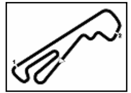
Autodromo Umbria 2.507 m